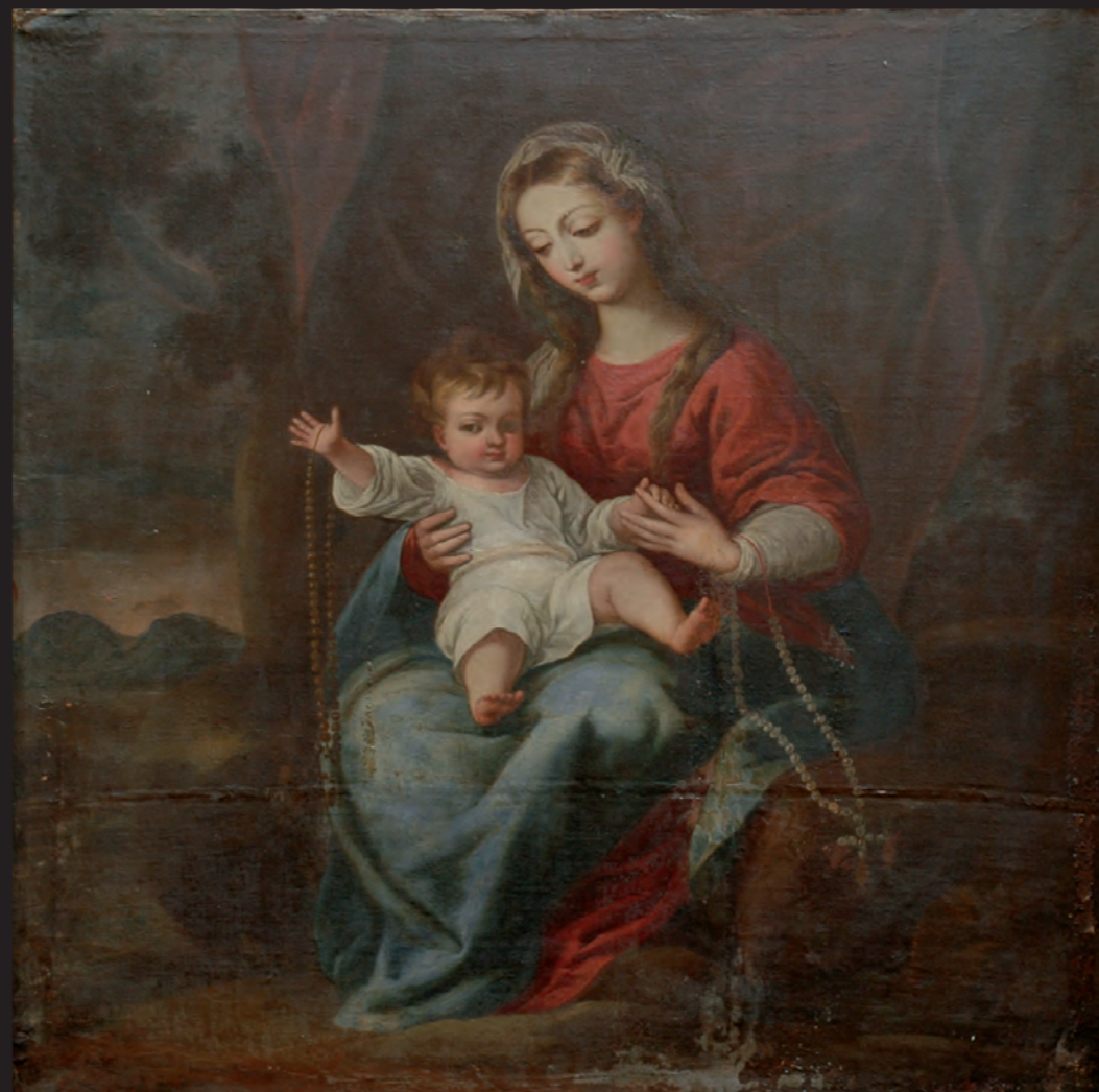
Pedro Atanasio Bocanegra: Virgen del Rosario

Escuela Granadina, S. XVIII: Niño Jesús de Pasión