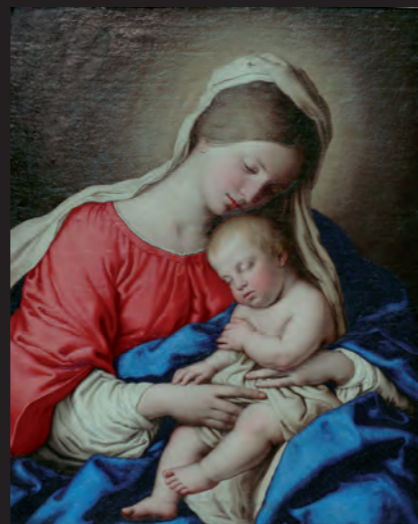
Il Sassoferrato: Virgen con Niño dormido

Cuentan que Santa Teresa, en su visita al monasterio conquense de Villanueva de la Jara, le regaló a la congregación la imagen de un Niño Jesús, al que le podían pedir todo lo que necesitará. Desde entonces la devoción en los conventos sobre todo femeninos de clau-